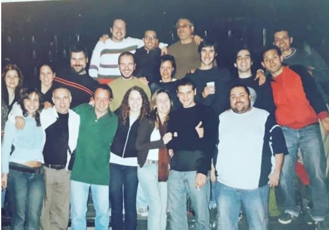
Parte del equipo creativo de la 1ra edición del Ciclo Carne Fresca. Sala La Fábrica. 2005. Ciclo Carne Fresca 2005