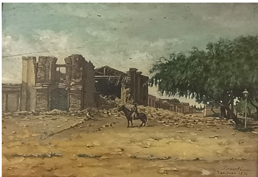
Figura 5. Obra Ruinas , Luis Brusotti, 1894, óleo s/ madera, 25 x 30,5 cm. Registro fotográfico realizado a partir de la obra original en el Museo Provincial de Bellas Artes Franklin Rawson, prov. de San Juan, el día 30 de abril de 2024.