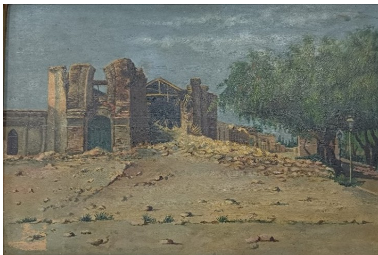
Figura 6. Iglesia , Daría Echagüe de Santibáñez, 1894, óleo s/madera, 42,2 cm x 32,8 cm (con marco), Museo Provincial de Bellas Artes Franklin Rawson, San Juan. Registro fotográfico realizado a partir de la obra original en el Museo Provincial de Bellas Artes Franklin Rawson, prov. de San Juan, el día 30 de abril de 2024.