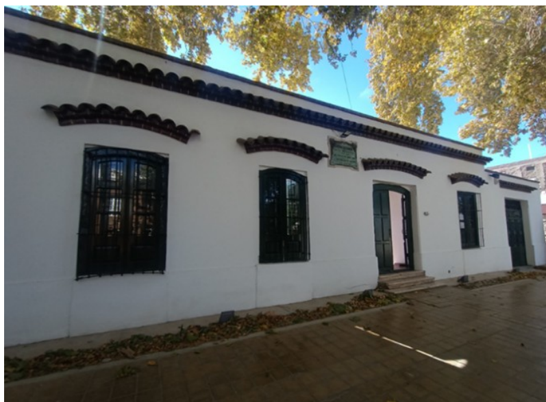
Figura 2. Fachada de la Biblioteca Infantil Provincial Juan Pablo Echagüe, ubicada en la calle 25 de mayo 463 oeste, San Juan. Registro fotográfico propio, realizado el día 30 de abril de 2024.