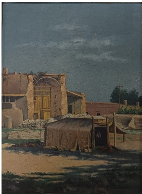
Figura 3. Obra Carpa de la Merced [antes Iglesia de La Merced], Daría Echagüe de Santibáñez, 1894, óleo s/ madera, 30,9 cm x 40,3 cm (con marco). Registro fotográfico realizado a partir de la obra original en el Museo Provincial de Bellas Artes Franklin Rawson, prov. de San Juan, el día 30 de abril de 2024.